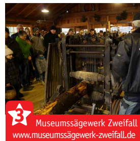
Museumssägewerk Zweifall www.museumssaegewerk-zweifall.de