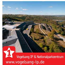
Vogelsang IP & Nationalparkzentrum www.vogelsang-ip.de

Nicht nur die historischen Stadt- & Ortskerne sind einen Besuch wert, auch einige weitere Highlights liegen an unserer Strecke und dort lohnt sich ein Stopp ebenfalls