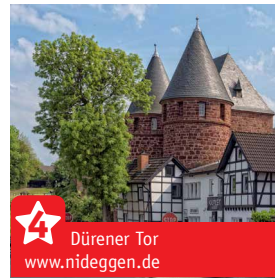
Dürener Tor www.nideggen.de