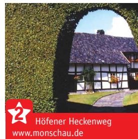
Höfener Heckenweg www.monschau.de