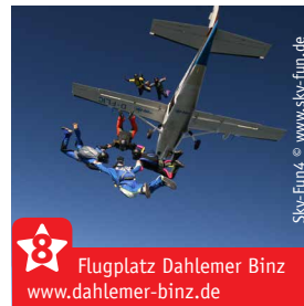
Flugplatz Dahlemer Binz www.dahlemer-binz.de