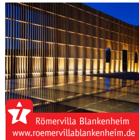
Römervilla Blankenheim www.roemervillablankenheim.de