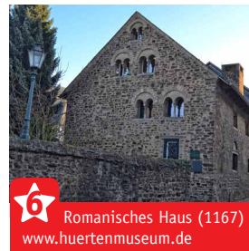
Romanisches Haus (1167) www.huertenmuseum.de