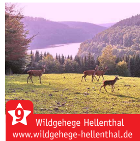
Wildgehege Hellenthal www.wildgehege-hellenthal.de