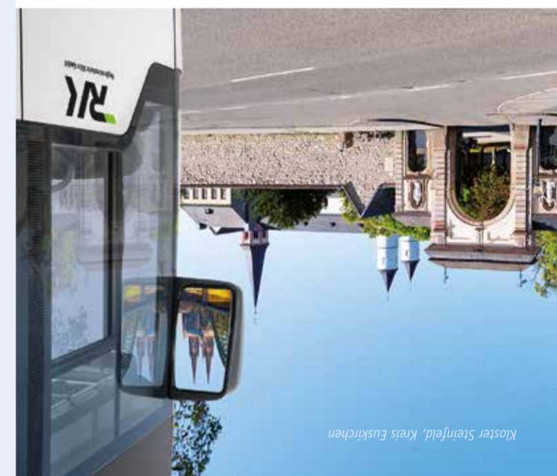
Kloster Steinfeld, Kreis Euskirchen